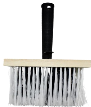
Макловица дер. корпус