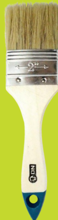
Кисть Евро TOPS (плотность)-60%

Искусственное расщепленное волокно. Кончики волокон правильно заострены и расщеплены, поэтому красящая кромка кисти мягкая и гладкая. Оцинкованная оправка, пластиковая ручка. TOPS (плотность)-100%. Применение: рекомендуются для работы с водно-дисперсионными красками, эмалями и лаками.