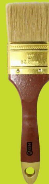
Кисть Профи TOPS (плотность)-65%

Отличаются более плотной набивкой. Натуральная светлая щетина. Каждый волосок имеет коническую форму и сужается к концу, на котором есть естественное расщепление. Все это обеспечивает хороший забор и удержание краски. Оцинкованная оправка, лакированная деревянная ручка. Применение: натуральная щетина подходит для работы со всеми видами ЛКМ.