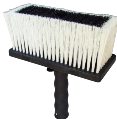
Макловица пласт. корпус